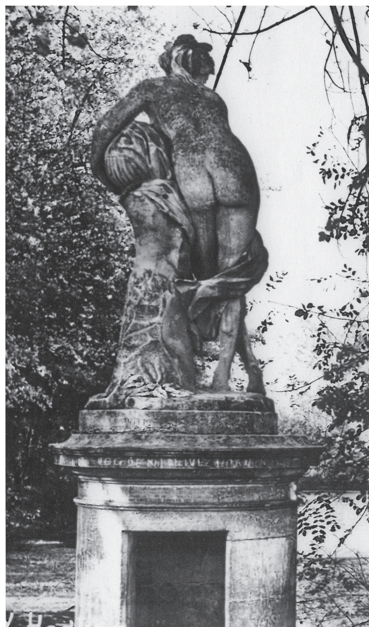
La statue de Cérès par P. Pérot (1773) déplacée au lac de la Blanchette.

Le lac est appelé communément «lac de Cora» et le parc appelé officiellement «parc de la Tuilerie».