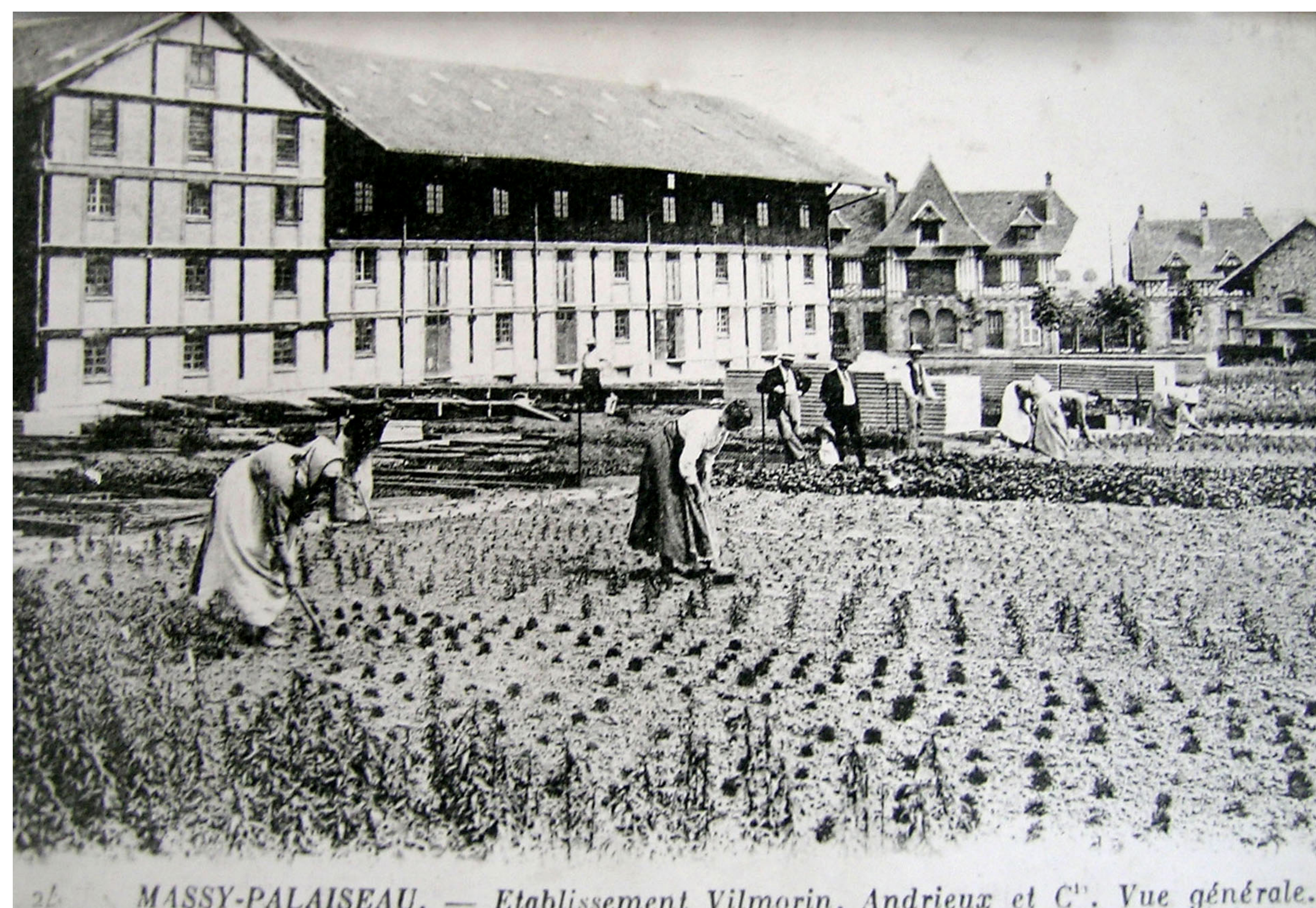
26. MASSY-PALaiseAU. — Etablissement Vilmorin, Andrieux et C ie . Vue générale.