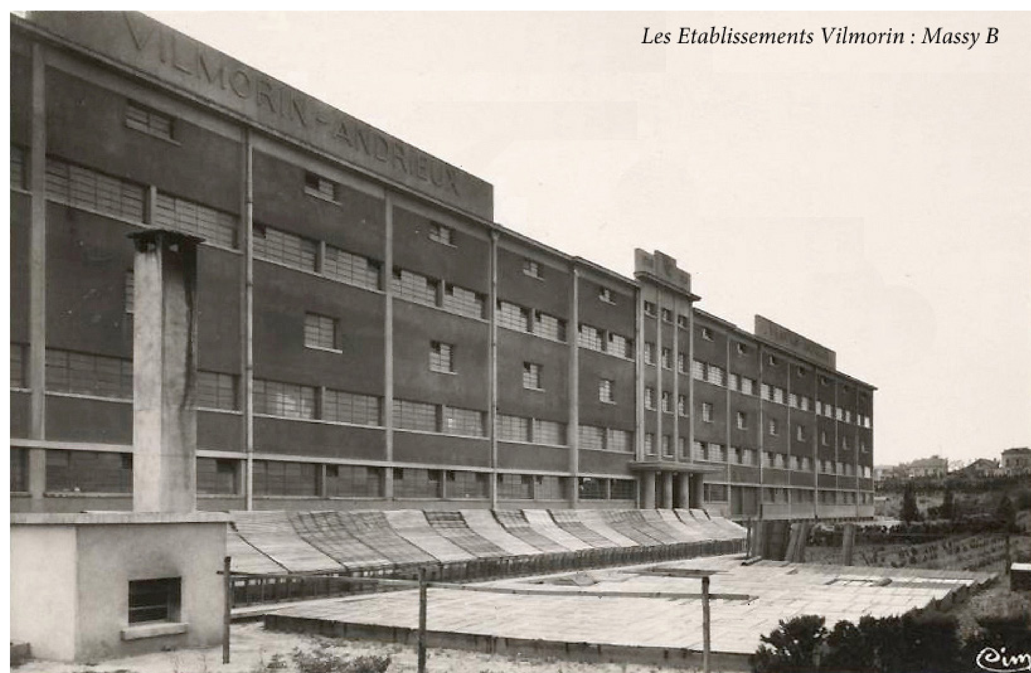
Les Etablissements Vilmorin : Massy B