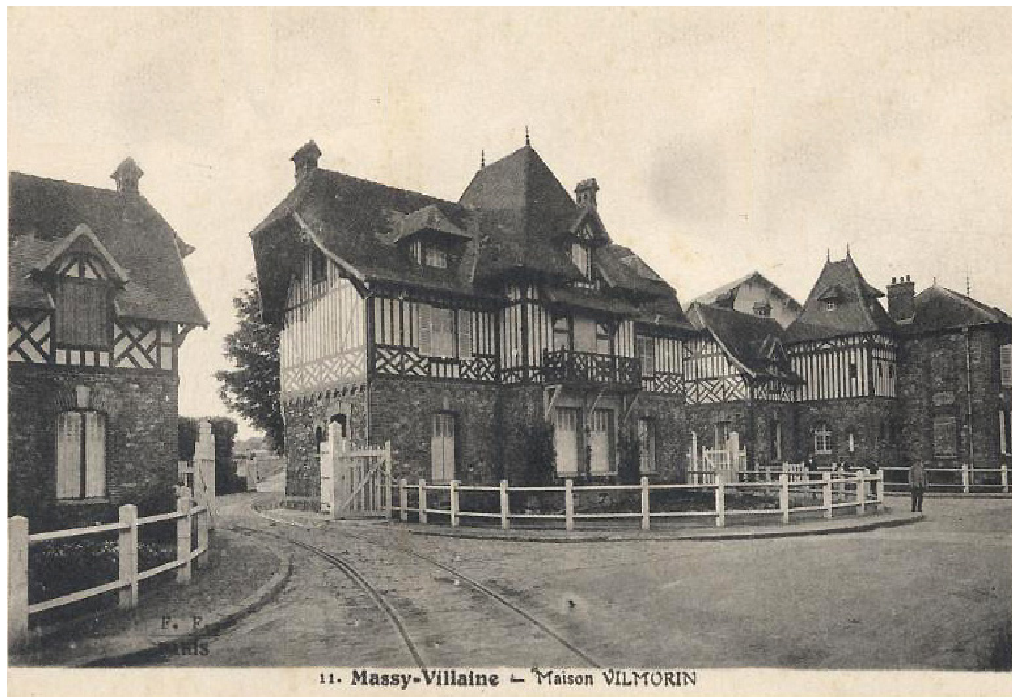
11. Massy-Villaine — Maison VILMORIN