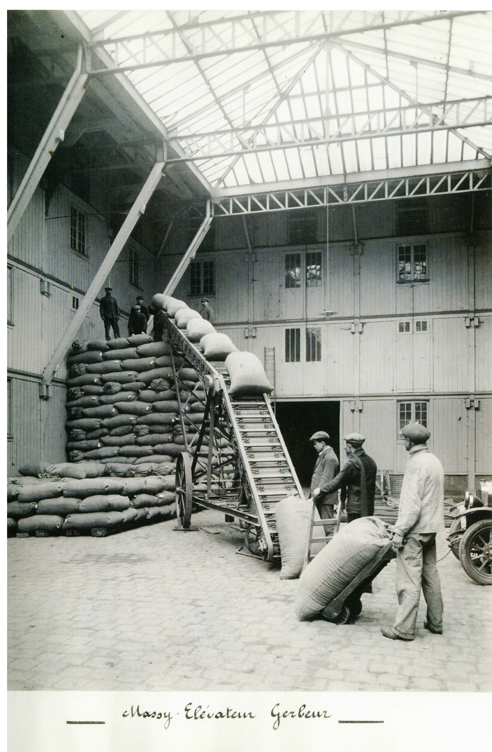
Massy. Elevateur Gerbeur

En 1940, un nouveau grand bâtiment, l'usine B, permet de moderniser le nettoyage et le triage des graines à l'aide d'une centaine de machines. De nouveaux services sont offerts au personnel : cantine et salles de détente. Dans les années 1950, l'usine connaît un nouvel essor avec l'accueil des installations de Reuilly puis de Verrières, dont les laboratoires. En 1972, la S.A. Vilmorin-Andrieux décide de s'installer dans le Val de Loire et abandonne la ferme de Massy qui est rasée. Les terrains resteront, pour l'essentiel, en friche jusqu'à ce que le projet du quartier résidentiel actuel voie le jour dans les années 2000.